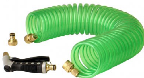
GARTENSPRITZE mit Flexschlauch