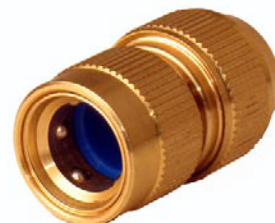
SCHLAUCHANSCHLUSS mit 6 Kugeln 1/2" ohne Wasserstop 1/2" mit Wasserstop 3/4" ohne Wasserstop 3/4" mit Wasserstop