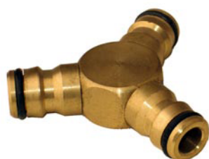
Y-VERTEILERSTÜCK 3 x Steckkupplung