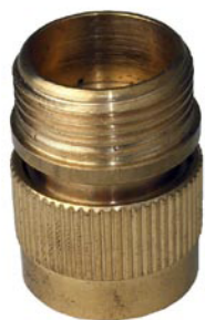
ANSCHLUSS 3/4" Innengewinde Außengewinde 3/4" ohne Wasserstop 3/4" mit Wasserstop